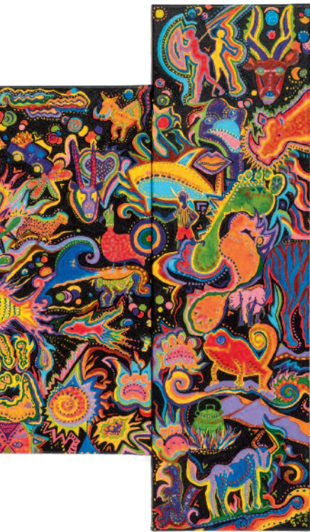
Ndasuunje (Papa) Shikongeni Humbleness Demut , 2014 Kartondruck / Cardboard print 61 x 53 cm Sammlung Würth, Inv. 17095