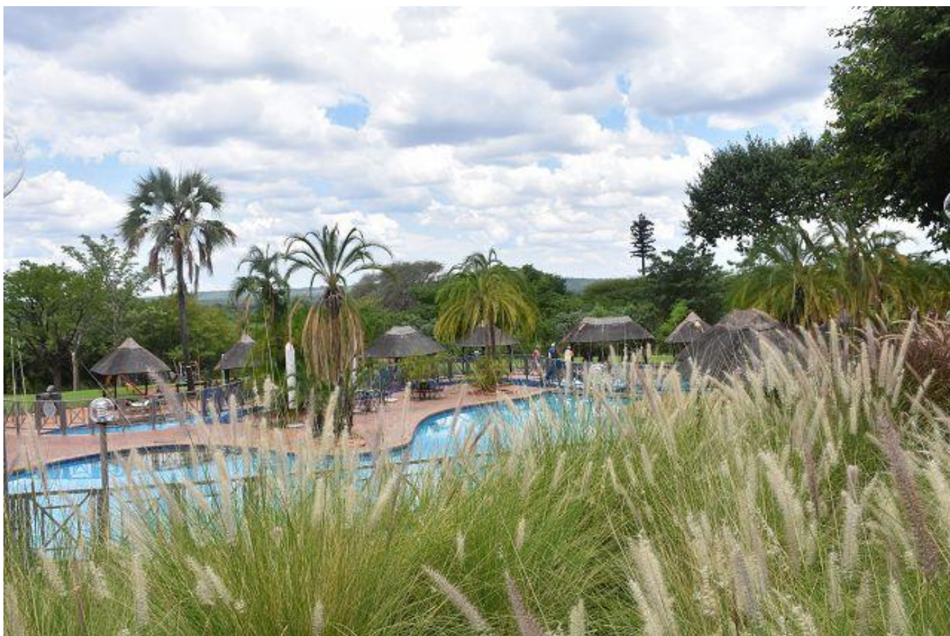
Elephant`s Hill Hotel mit 18 Loch Golfplatz