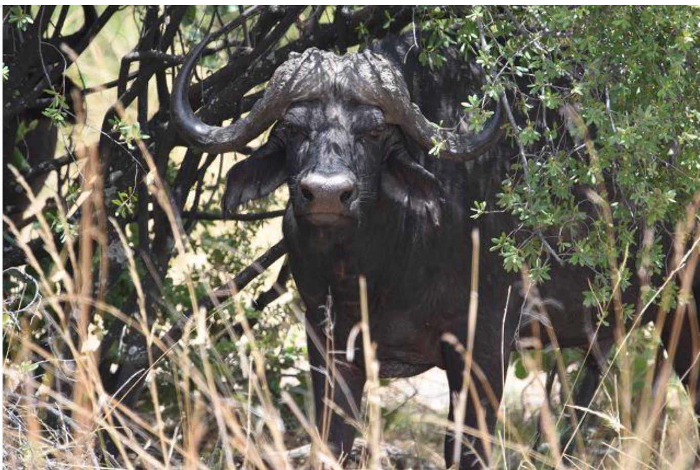
Büffel und unten Moorantilope, nur hier am Linyanti heimisch