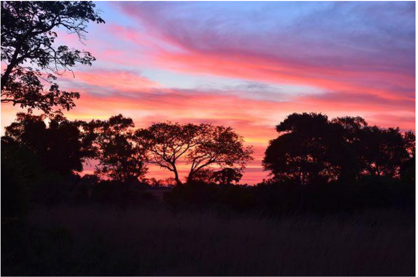
Sonnenaufgang am 2. Dezember um ca. 05 30