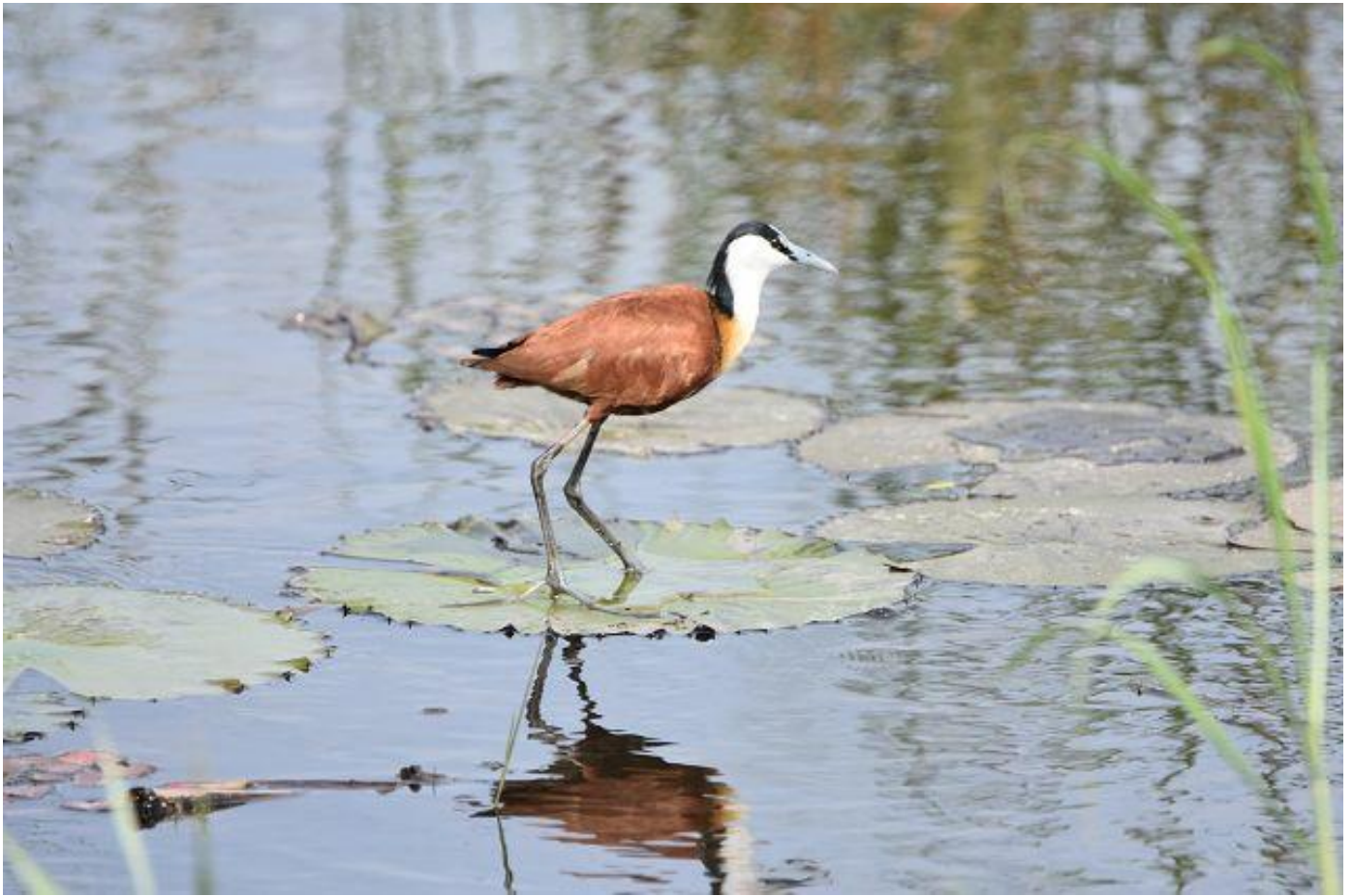
Blaukopf-Blatthühnchen und Gelege