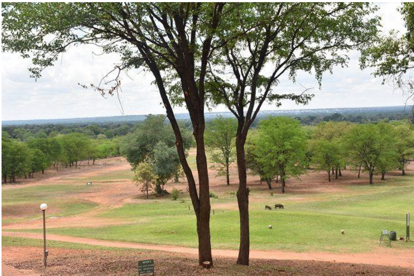
Bei 36 Grad eine Runde gespielt, mit Caddy und einigen Wildschweinen.