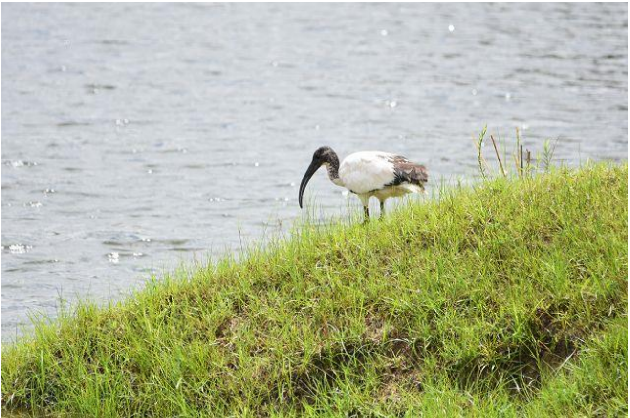
^ Heiliger Ibis v afrikanischer Klastschnabel

Für 2 Nächte fahren wir in den wenig besuchten Zambezipark. Ein Plattfuss,(am O'Boss), und wenige Tiere, aber landschaftlich schön am Fluss Zambezi.