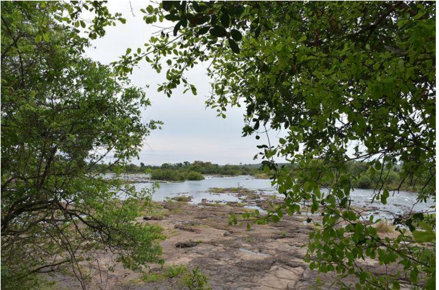
Der Zambezi oberhalb der Fälle