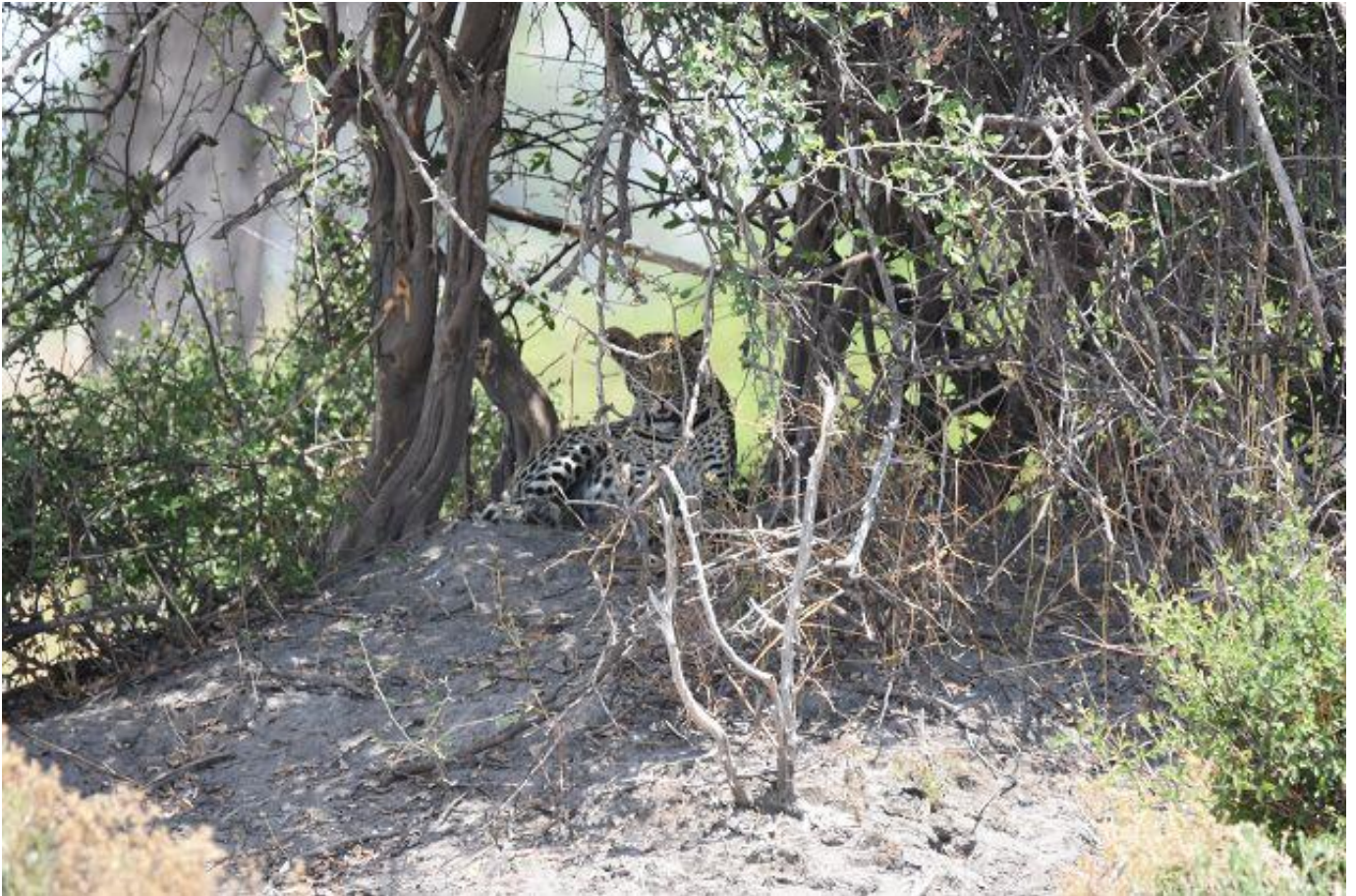
Ein prachts LEOPARD