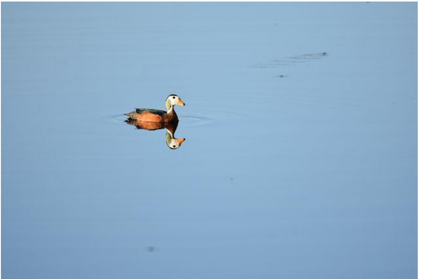
^ afrikanische Zwerggans v Scharlachspint